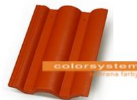
Danubia Tehlovo červená