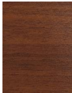
Noce sor. balsamico